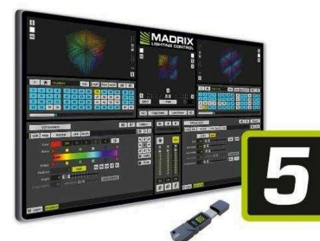
Программное обеспечение для обработки звука от 3 700 р.