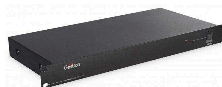
Подавители обратной связи от 32 790 р.