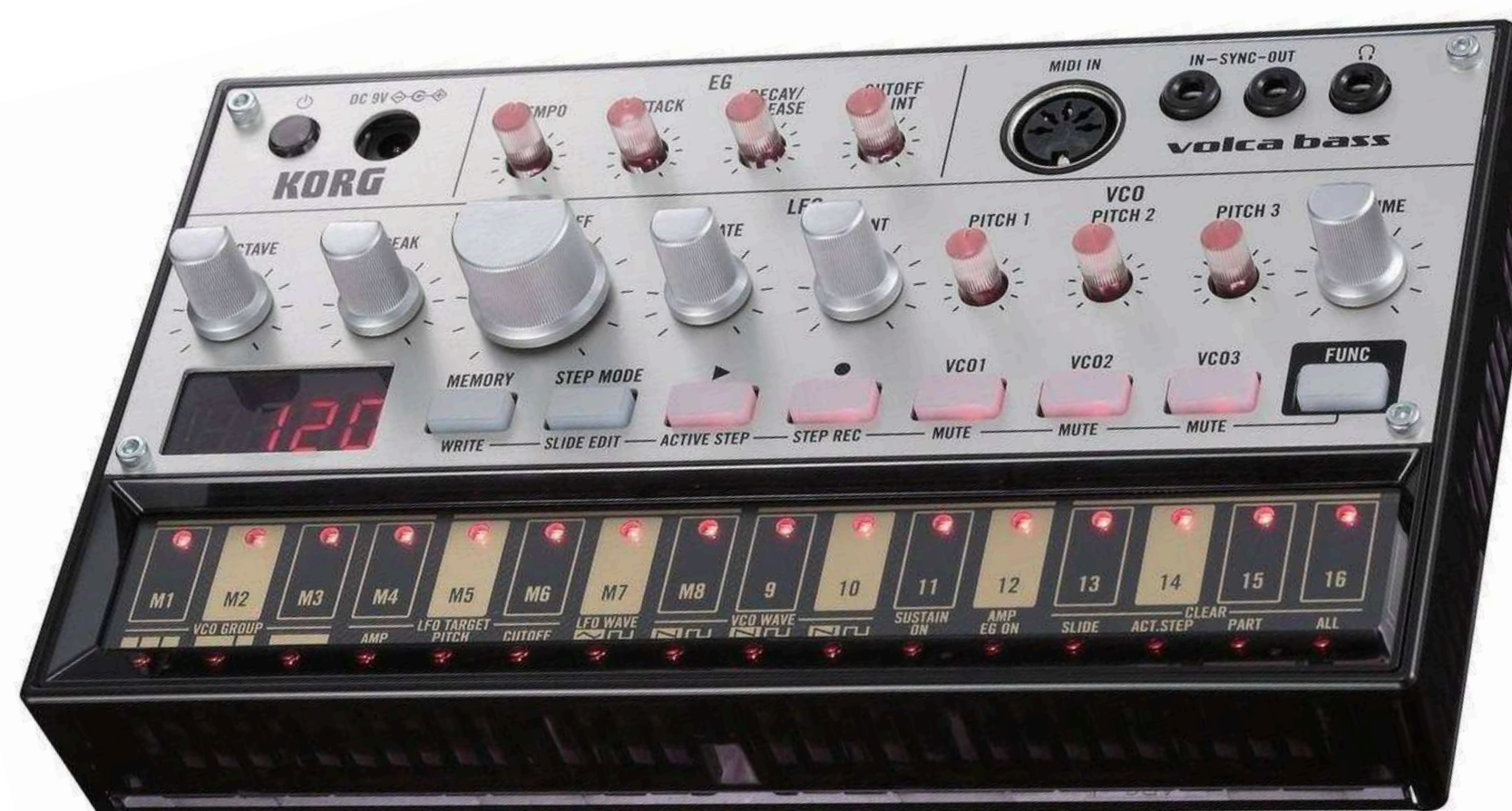
Грувбоксы и компактные синтезаторы от 7 700 р.

Подберем оборудование точно под задачу по этим характеристикам: