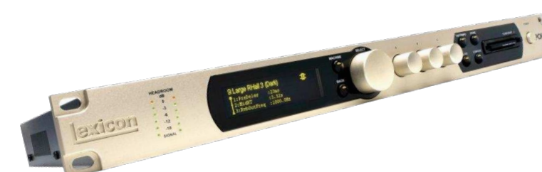
Процессоры эффектов от 25 800 р.