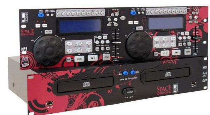
DJ проигрыватели от 25 160 р.