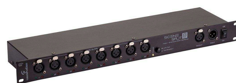
Микрофонные микшеры от 22 880 р.