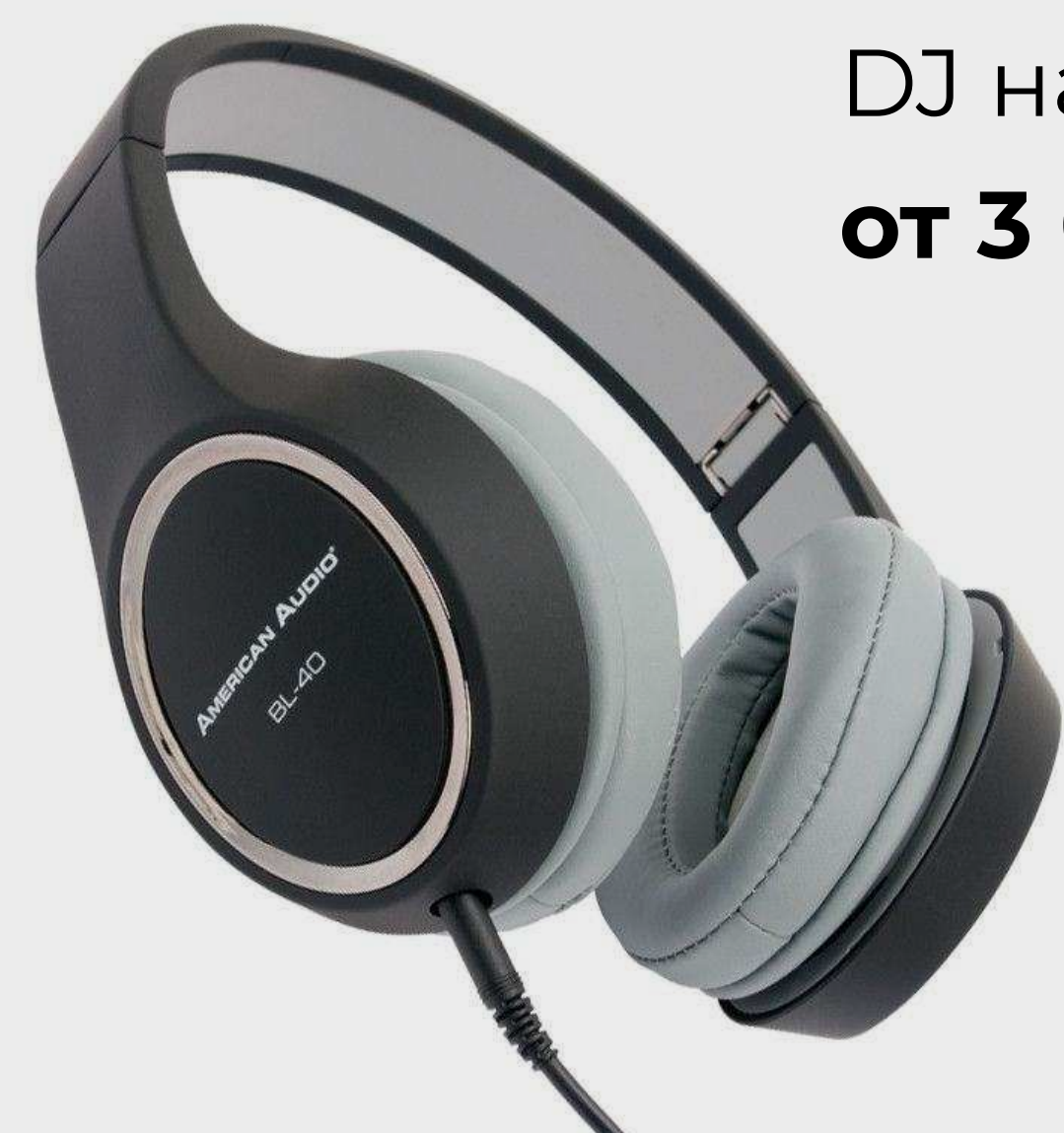
DJ наушники от 3 010 р.