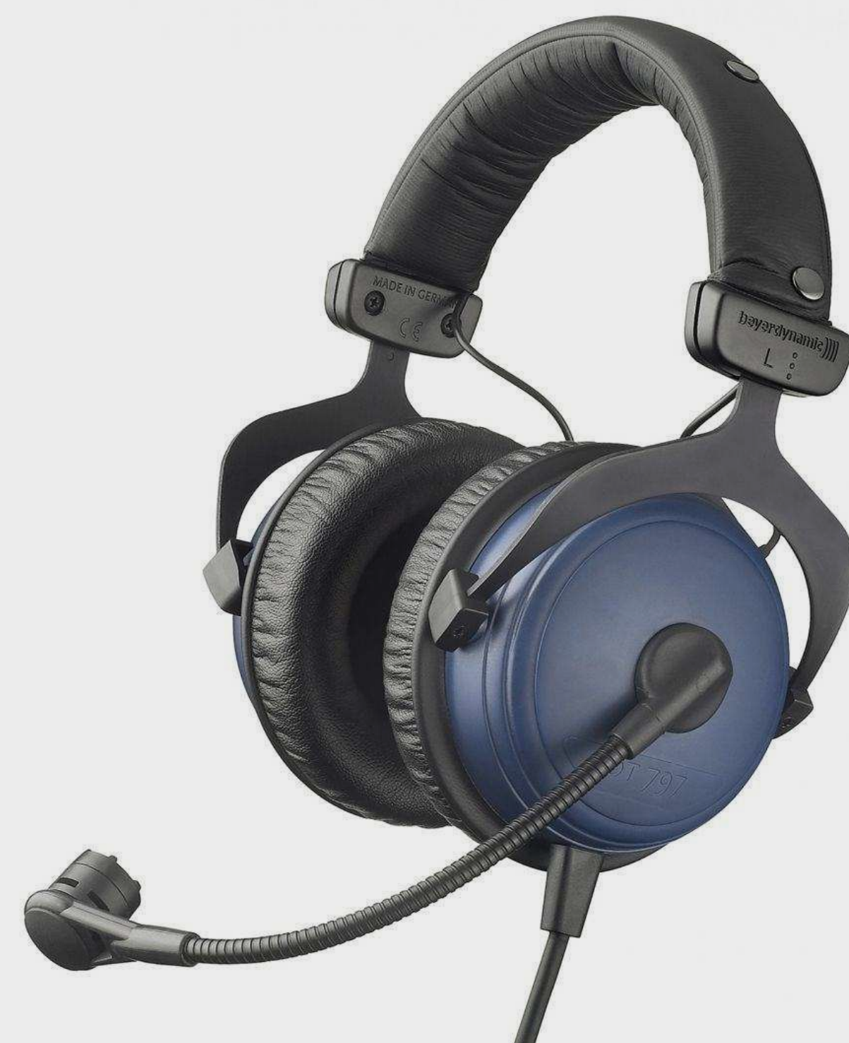
Наушники с гарнитурой от 2 100 р.