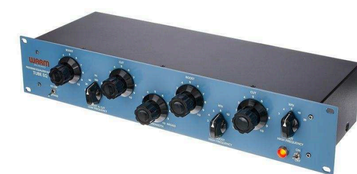
Эквалайзеры от 9 870 р.

Подберем оборудование точно под задачу по этим характеристикам: