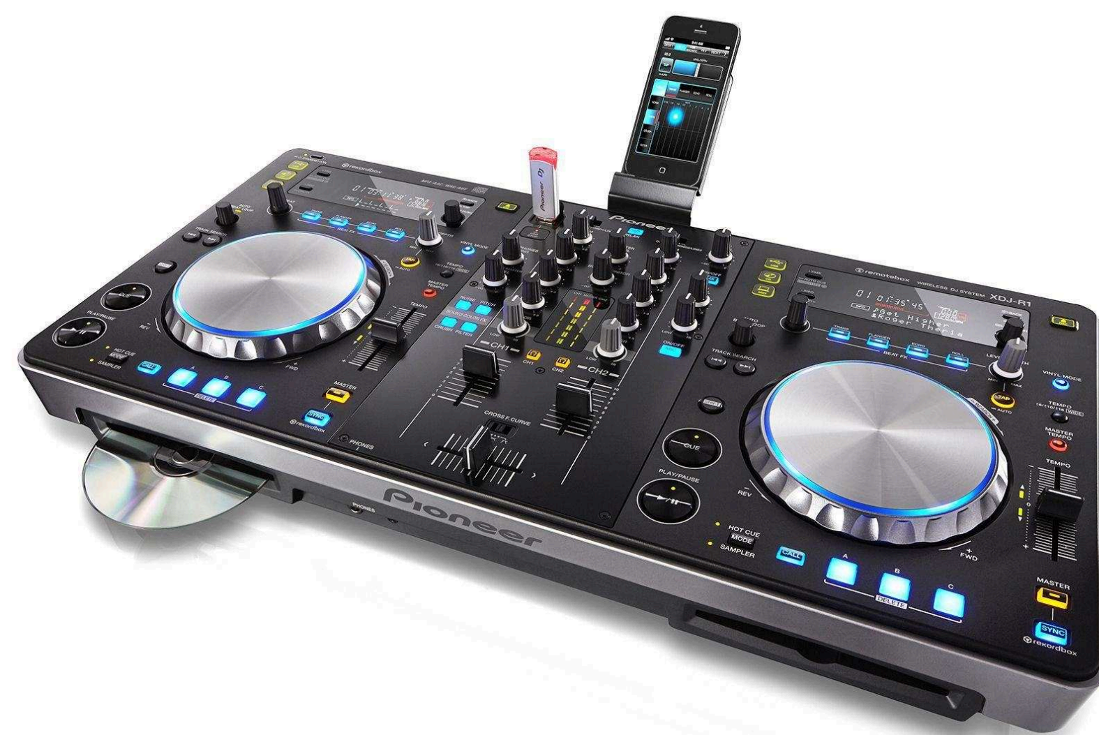
DJ-станции и комплекты Цена по запросу