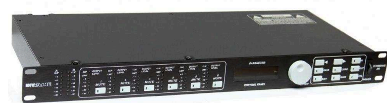
Кроссоверы от 13 990 р.