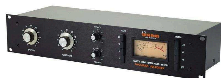
Лимитеры и сплиттеры от 14 150 р.