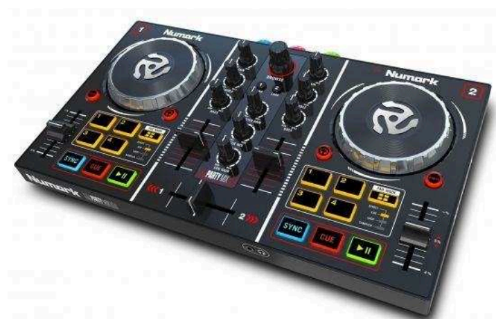
DJ контроллеры от 12 580 р.