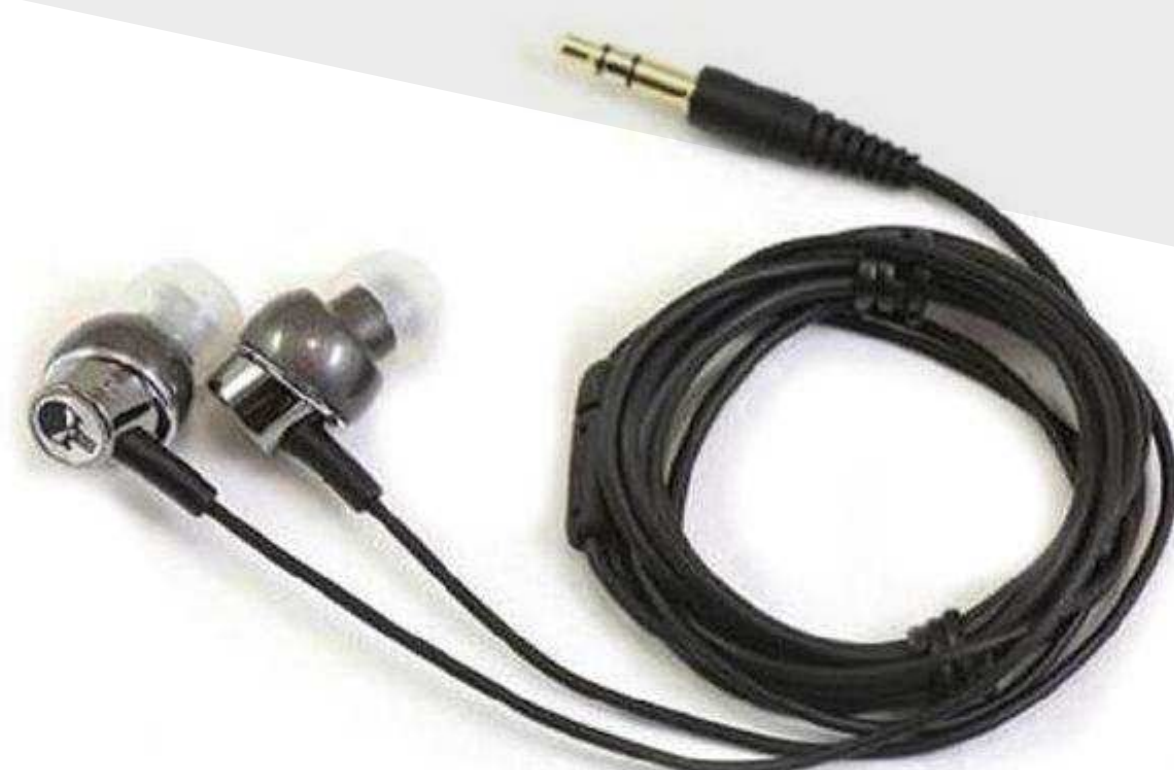
Внутриканальные наушники от 2 310 р.