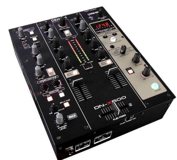
DJ микшерные пульты от 6 600 р.