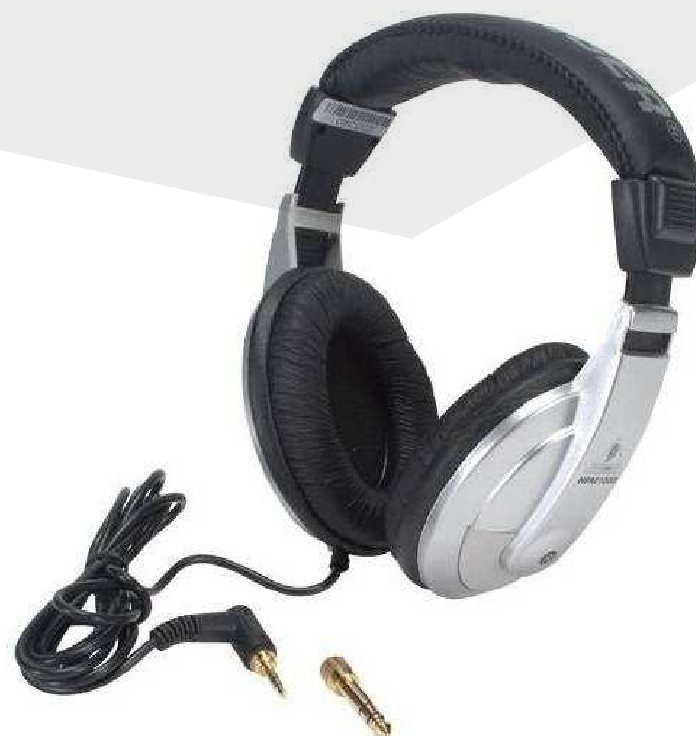
Студийные наушники от 1 550 р.

Подберем оборудование точно под задачу по этим характеристикам: