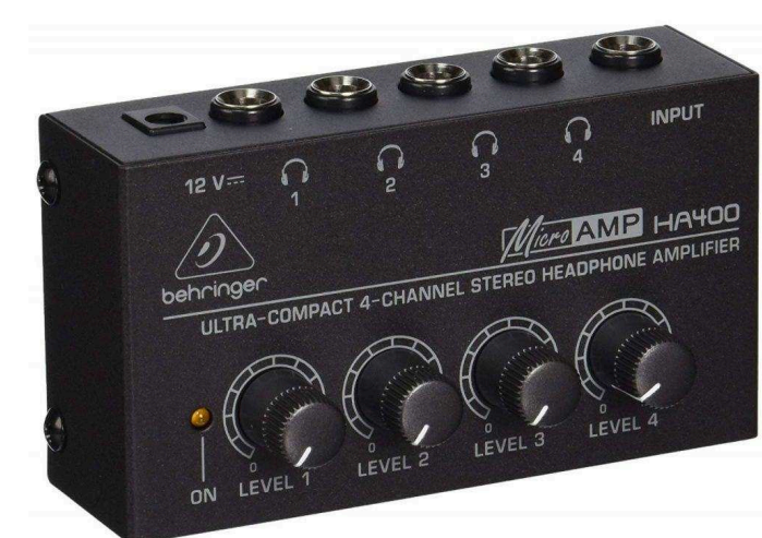
Усилители и предусилители для наушников от 2 500 р.