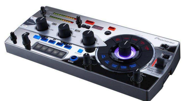
DJ процессоры эффектов Цена по запросу