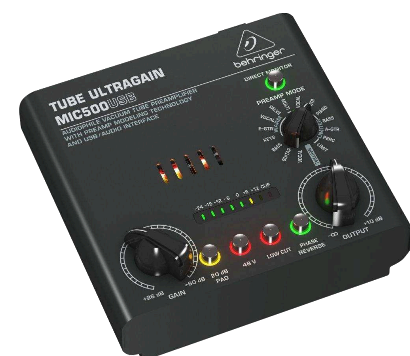
Микрофонные предусилители от 8 990 р.