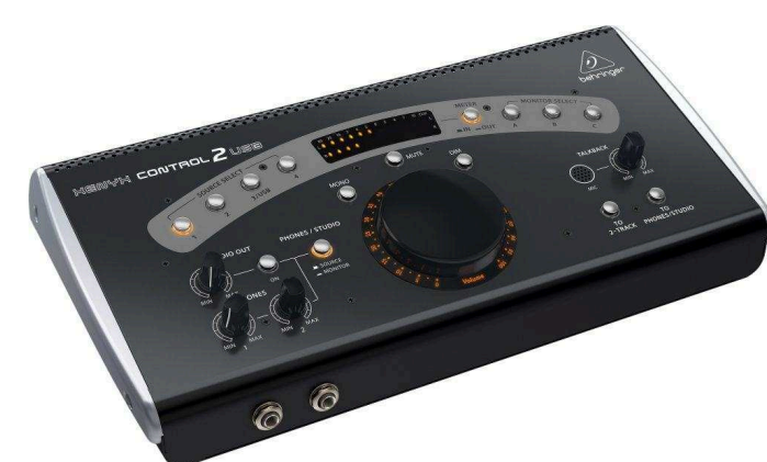
Процессоры управления от 6 280 р.